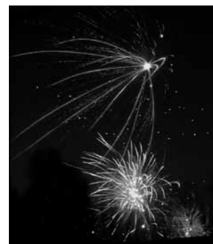
Mot stjärnorna.

Vi kommunister vill det inte, vi vill kamp mot kapitalet och deras anförvanter i de rasistiska organisationerna i Sverige. Låt 2013 bli en nystart – organisera dig i Sveriges Kommunistiska Parti.