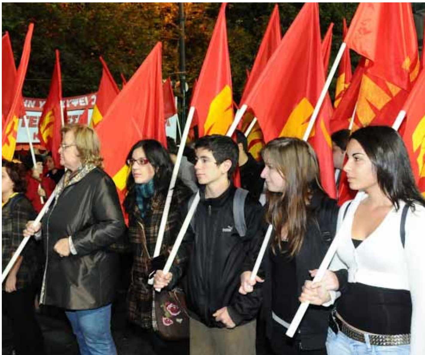
Greklands Kommunistiska Parti uttalar sig om SYRIZA.