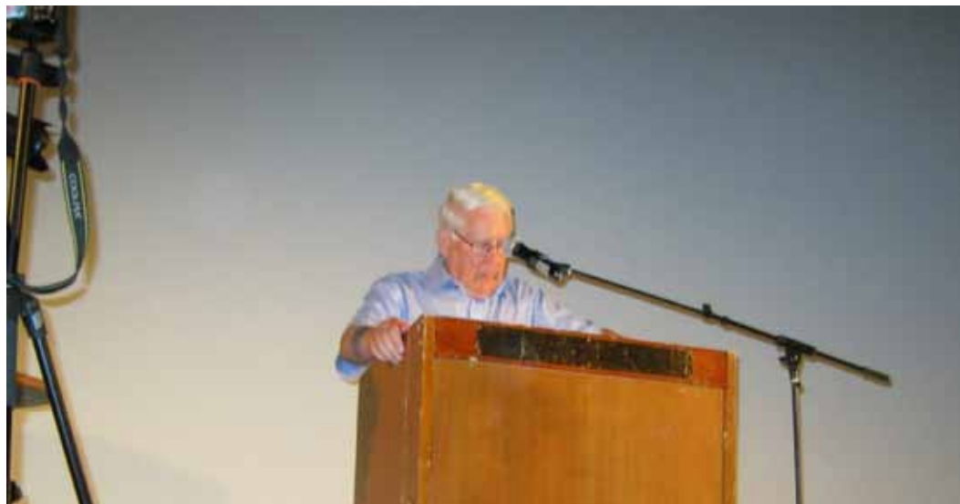
Tidigare försvarsministern Thage G. Peterson