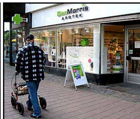
Argumentet för att privatisera Apoteket och öppna upp för konkurrens med nya privata apotekskedjor var att tillgängligheten skulle öka.